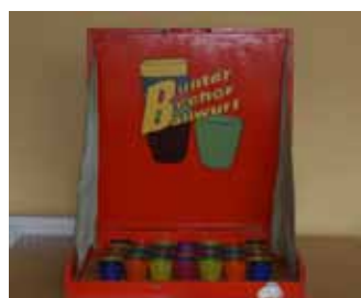
Bunter Becher Ballwurf