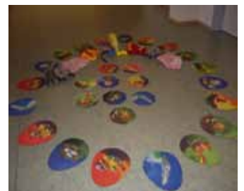
Zicke Zacke Hühnerkacke