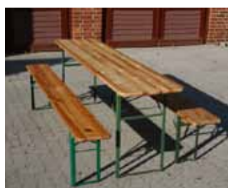
Tisch & Bank